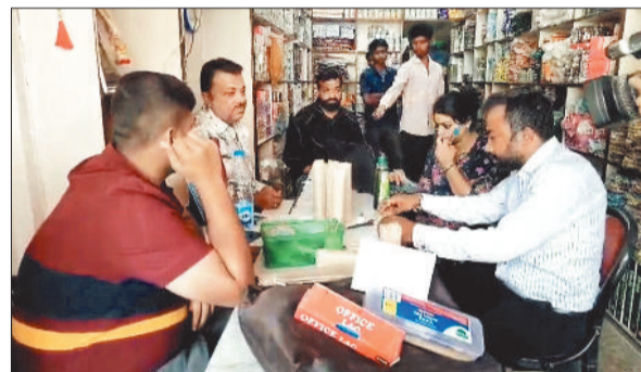
जांच करती खाद्य एवं औषधि प्रशासन की टीम।