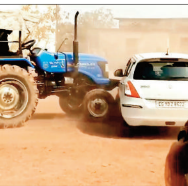
सम्मान में विदाई पार्टी का आयोजन किया गया। इस दौरान दो छात्र ट्रैक्टर और कार ड्राइव करते

बिलासपुर। जिले के शासकीय उच्चतर माध्यमिक विद्यालय सर्करा में आयोजित फेयरवेल पार्टी के दौरान छात्र रील बनाने और स्टंट दिखाने के चक्कर में अपनी जान जोखिम में डालते नजर आए। पार्टी के दौरान कुछ छात्र ने कार और ट्रैक्टर लेकर स्कूल परिसर में घुसकर स्टंटबाजी की। इसी दौरान कार और ट्रैक्टर की जोरदार टक्कर हो गई। हालांकि इस टक्कर में दोनों वाहन में सवार छात्र बाल-बाल बच गए। छात्रों के स्टंटबाजी का वीडियो भी सामने आया है। दरअसल शासकीय स्कूल में सीनियर छात्रों के