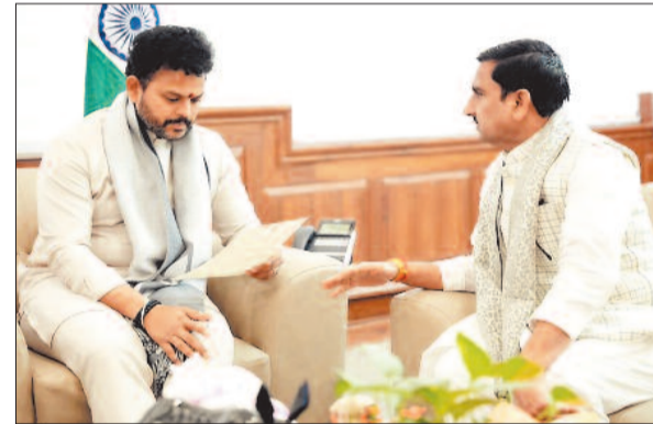
केन्द्रीय नागरिक उड्डयन मंत्री नायडू से चर्चा करते केन्द्रीय राज्यमंत्री तोखन साहू।