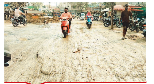
अशोकनगर में नाली निर्माण के दौरान सड़क पर कीचड़ फैला।