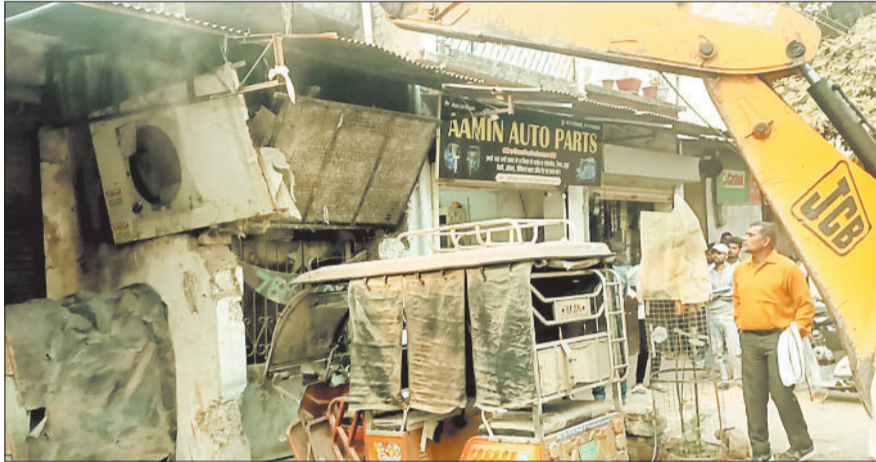
दुकानों के सामने से अतिक्रमण हटाता नगर निगम का अमला।

ध्यान रहे कि शहर के अग्रसेन चौक से पुराना बस स्टैंड, श्रीकांत वर्मा मार्ग और महाराणा प्रताप चौक से नेहरू चौक तक के क्षेत्रों को पहले ही ट्रैफिक वायलेशन फ्री ज़ोन घोषित किया जा चुका है। इन इलाकों में यातायात नियमों का उल्लंघन करने वालों पर बिना