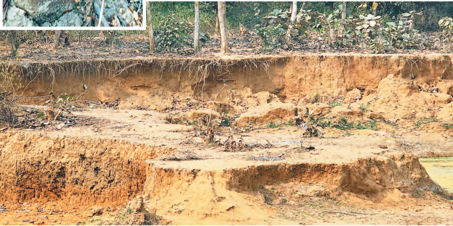
मोपका क्षेत्र में भू माफिया द्वारा अवैध मिट्टी उत्खनन करने के कारण काटे गए सैकड़ों सागौन के पेड़।